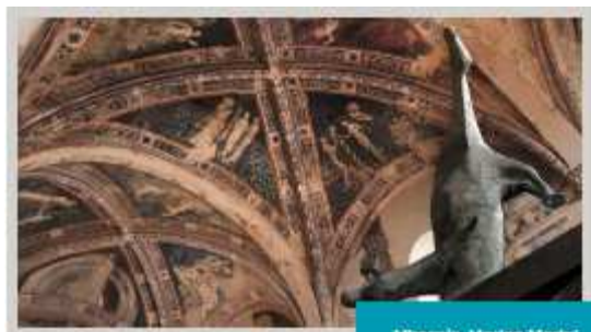
Miracolo, Marino Marini