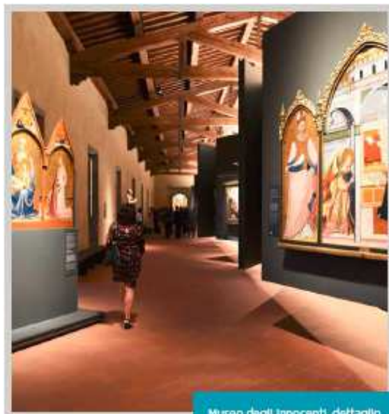
Museo degli Innocenti, dettaglio

Questi, nel dettaglio, gli itinerari proposti: