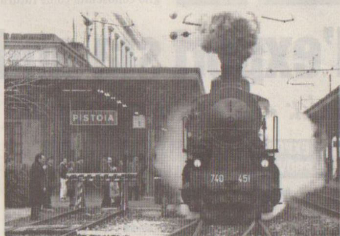
Un vecchio treno pronto a ripercorrere la Porrettana